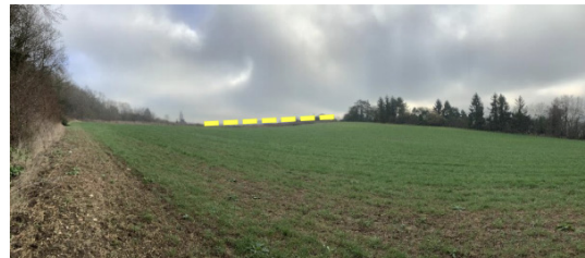
Anomalie de topographie: contre-pente

Les deux anomalies sont associées sur le terrain et permettent aux géologues de proposer des hypothèses sur la géométrie profonde du glissement de terrain puis de l'ausculter par des méthodes géophysiques.