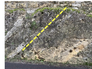
Anomalie de pendage: Les couches sont inclinées